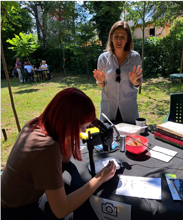
Јаковљев у припреми Dreosophyl-е за посматрање популације истих (уочавање разлике између мужјака и женк)