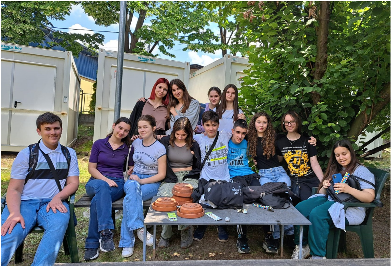
Ученици 1/11 у дворишту Института „Истраживачка станица на овореном“