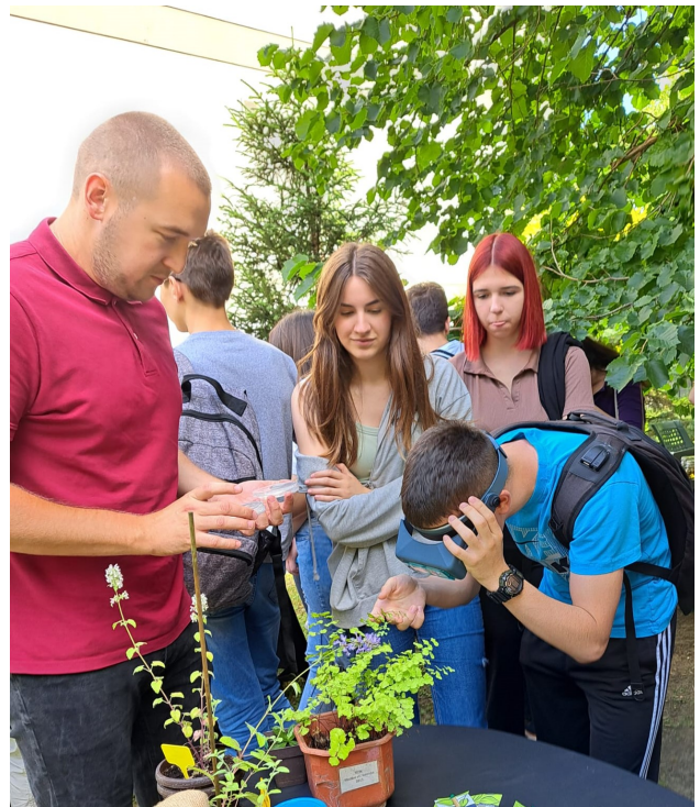
Урош посматра (угрожене и заштићене врсте биљака) гајеним у лабораторијским условима